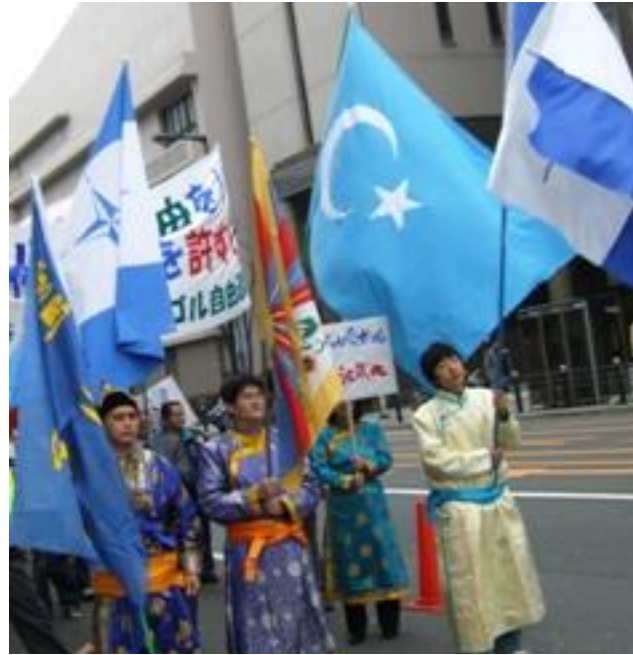
الحزب الشيوعي الصيني