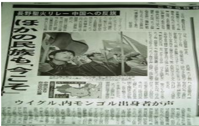
الحزب الشيوعي الصيني